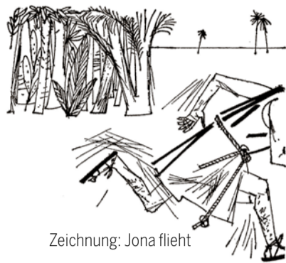
Zeichnung: Jona flieht

Samstag, 10. Juni 2017, 18 Uhr / 19 Uhr / 21 Uhr in der Ref. Kirche Spiez